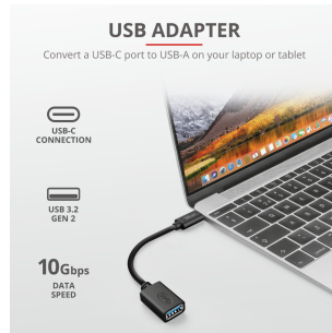
PRODUCT PICTORIAL 1