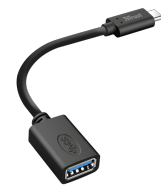
PRODUCT VISUAL 2