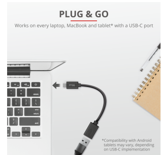
PRODUCT PICTORIAL 2