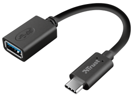
PRODUCT VISUAL 1