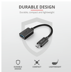
PRODUCT PICTORIAL 3