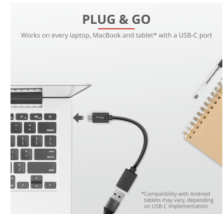
PRODUCT PICTORIAL 2