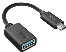
PRODUCT VISUAL 3